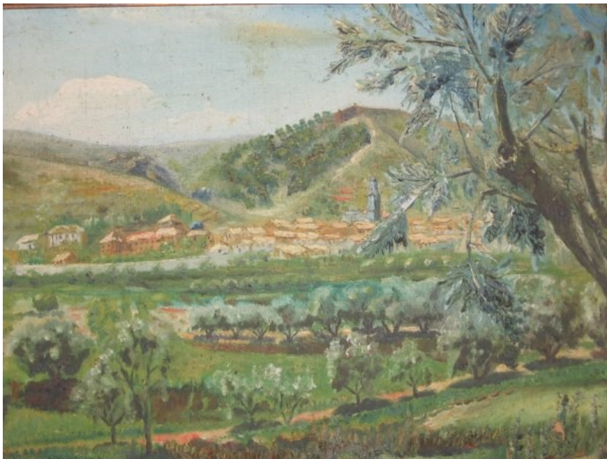
Os recordamos con cariño La Sierra, fundación de la Comunidad Valenciana